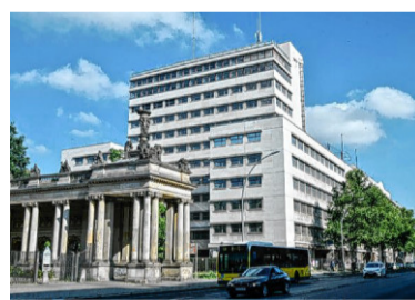
Die Königskolonnen (l.) neben dem leer stehenden Gebäude.